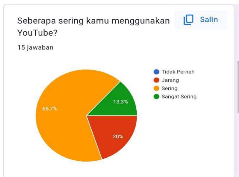
Gambar 2. Diagram Penggunaan Aplikasi