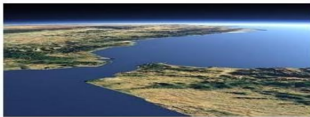
Gambar 1. Selat Gibraltar

tersebut cukup besar, seperti pada keadaan gas, gaya ini sangat kecil dan hanya berupa gaya tarik. Namun, gaya tarik ini akan menjadi lebih besar jika gas dikompres dan jarak antara molekul-molekulnya diperkecil. Ketika zat cair dikompres, tekanan yang besar diperlukan untuk memaksa molekul-molekul agar lebih dekat satu sama lain. Pada jarak yang sedikit lebih kecil dari dimensi molekul, gaya ini menjadi gaya tolak yang relatif besar 16 . Gaya tarik-menarik antara partikel atau molekul sejenis yang disebabkan oleh sifat kelistrikan ini dikenal sebagai gaya kohesi. 17 Gaya-gaya kohesi inilah yang menciptakan kesan adanya lapisan tipis yang memisahkan antara zat cair satu dengan yang lain, dan mampu menahan benda-benda kecil di permukaan zat cair tersebut. Karena gaya-gaya kohesi ini menyebabkan permukaan zat cair menjadi tegang, sifat ini disebut sebagai tegangan permukaan. Tegangan permukaan terjadi karena adanya gaya-gaya kohesi resultan yang membuat permukaan zat cair menjadi tegang. 18