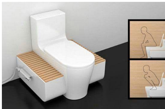
Gambar 2 Toilet Multifungsi

Hal pertama yang perlu diluruskan adalah persepsi masyarakat terhadap toilet jongkok. Kita dapat berkaca pada negara lain, seperti Jepang, sebagai salah satu negara maju dengan tingkat kebersihan yang tinggi juga masih menggunakan toilet gaya jongkok, tetapi dengan desain yang lebih modern. Mengoptimalkan desain toilet jongkok dan meningkatkan kenyamanan, serta higienitas dapat menjadi solusi agar bisa mengubah persepsi masyarakat dan membuat masyarakat lebih tertarik untuk memilih menggunakan toilet jongkok. Kemudian, jika toilet duduk di rumah telah dibangun dengan gaya toilet duduk, maka dapat ditambahkan dingklik atau bangku. Kuncinya adalah ada media tambahan untuk mengangkat kaki agar tercipta posisi jongkok. Selain itu, jika alasan penggunaan toilet duduk untuk memudahkan lansia, ibu hamil, atau orang dengan cedera lutut, maka diusulkan adanya perluasan distribusi produk inovasi jajakan pada toilet jongkok dari India yang mampu membuat orang dengan keseimbangan tubuh yang tidak ideal tetap nyaman ketika memijak pada jajakan, yakni toilet SquatEase . Tentunya dalam mengimplementasikan solusi-solusi yang telah disampaikan, memerlukan kerja sama dari berbagai pihak.