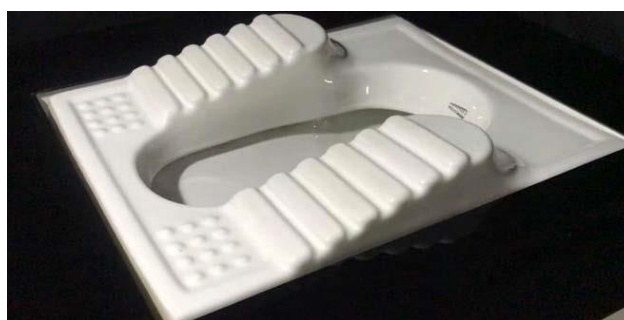
Gambar 4 Toilet SquatEase