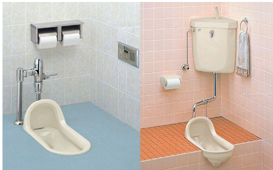
Gambar 3 Modernisasi Toilet Jongkok